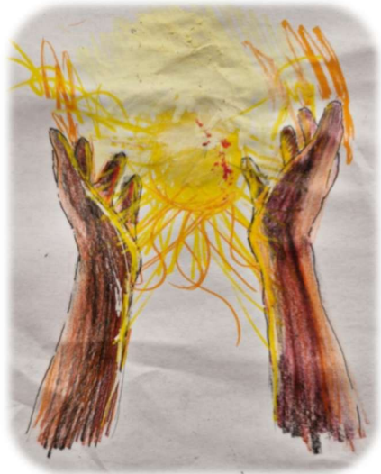
Gúti Lilla rajza (13 éves)

Felfedted nekem a múltat. Egy pillanatra ott voltam A szent sátor legbelsejében, Az első templom dicsőségében. Láttam a papokat, kik ott jártak, Mikor imádtak és elfordultak.