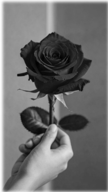
A kép MI.

Mindez egy kis kedvesség, egy szál vörös rózsza miatt.