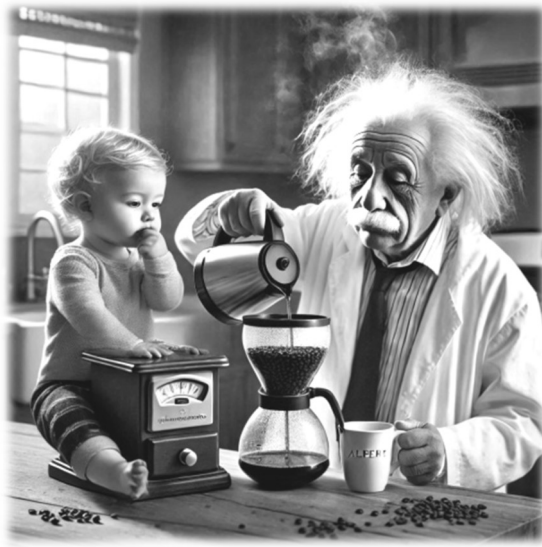
A kép MI.

Nem. Ő erről semmit sem tudott, csak lefőzött egy kávé, hogy aztán jó sok cukorral jóízűen megigya, helyre téve a tegnapi töltött káposztával alaposan meggyötört bélflóráit. Majd az elhasznált kávéfiltert a benne lévő zaccal együtt kidobta. Hiába no, Albert Einbogsteinnak megint igaza volt. Az idő igenis relatív!